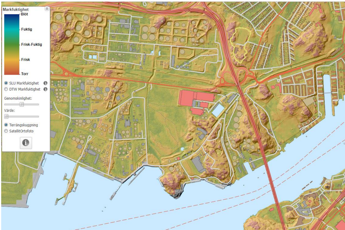
Figur 2. Markfuktighetsdata inhämtat från SLU 2023-06-12 för Rya skog och dess närområde.